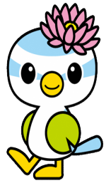
蓮田市マスコットキャラクター はすぴい